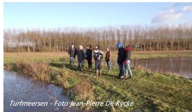
Turfmeersen