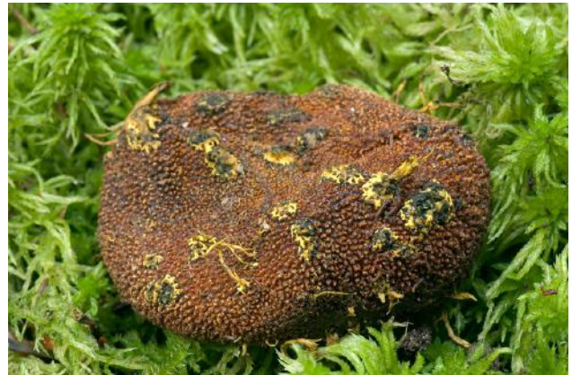
Stekelige hertentruffel