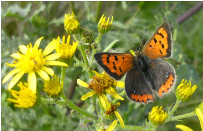
Kleine vuurvlinder (boven) - Oranje zandoogje (onder)

Een twintigtal minuten wandelen over droge zandgrond levert niks op, zelfs voor vlinders te warm. En plots trekt een fel azuurblauw onze aandacht. Een icarusblauwtje is opgeschrikt en fladdert weg. Dit is