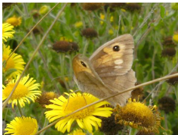
Bruin zandoogje (boven), napraten aan de boshut (onder)