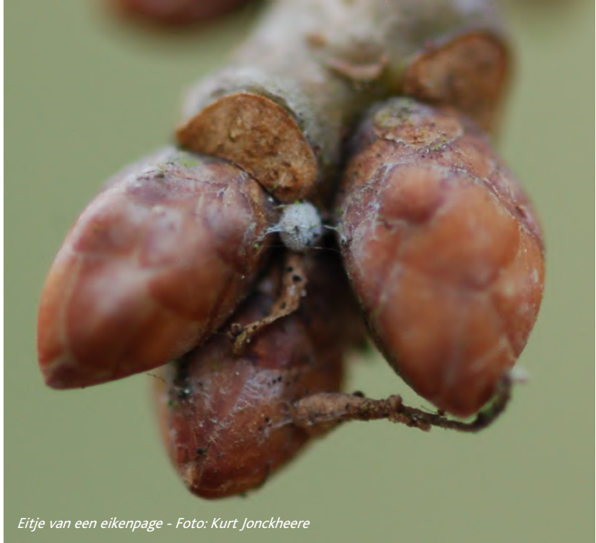
Eitje van een eikenpage

Je kan de eitjes zoeken op een hoogte van anderhalve tot drie meter aan de onderste takken en zonnigste kant van de zomereiken. De eitjes zijn er al op het einde van de zomer, maar hoe verder in de winter, hoe minder blaadjes er nog aan de eik hangen en hoe 'gemakkelijker' het wordt om een eitje te vinden. Een leuk tijdverdrijf tijdens de komende maanden !