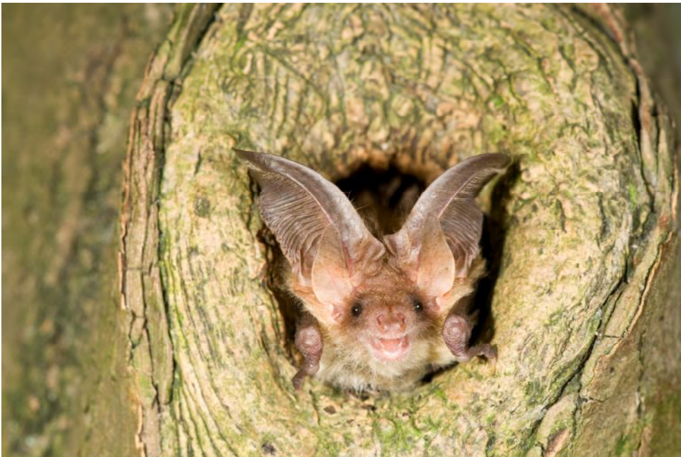
Gewone grootoorvleermuis

Het waren leuke en interessante avonden en alle vleermuissoorten werden op de website 'waarnemingen.be' gezet. Volgend jaar gaan we zeker verder met onderzoeken om meer zicht te krijgen op de kolonies.